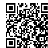
Vidéo CHU Besançon